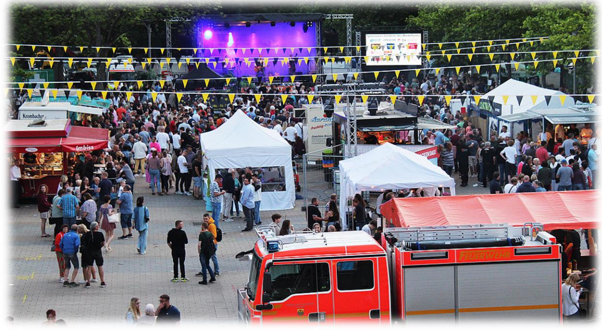
Knapp 5 000 Gäste besuchten das Glinde Marktfest 2022

Markt 21. 5. | 25. 5. | 18. 6. 2022 || www.glinde.de 20. 6. 2022, Zugriff 27. 6. 2022 || GZ 1. 6. | 22. 6. 2022