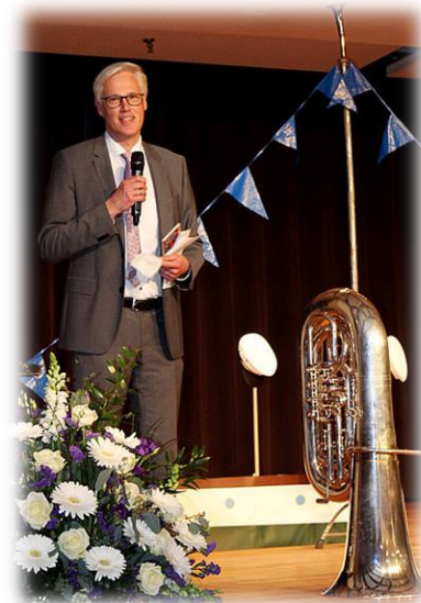
Bürgermeister Rainhard Zug