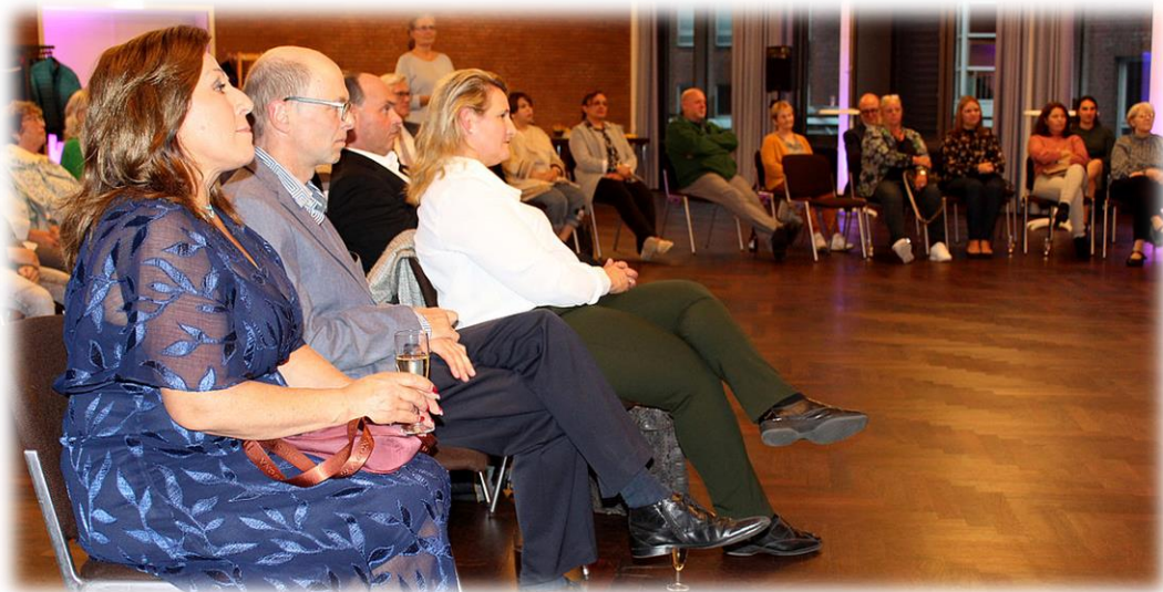
Auf Einladung des Gliner Frauenforums hieß es am 17. September »30 Jahre Gleichstellungsbeauftragte in Glinde« im Festsaal des Marcellin-Verbe-Hauses

GZ 14. 9. | 28. 9. 2022 || Markt 17. 9. | 8. 10. 2022