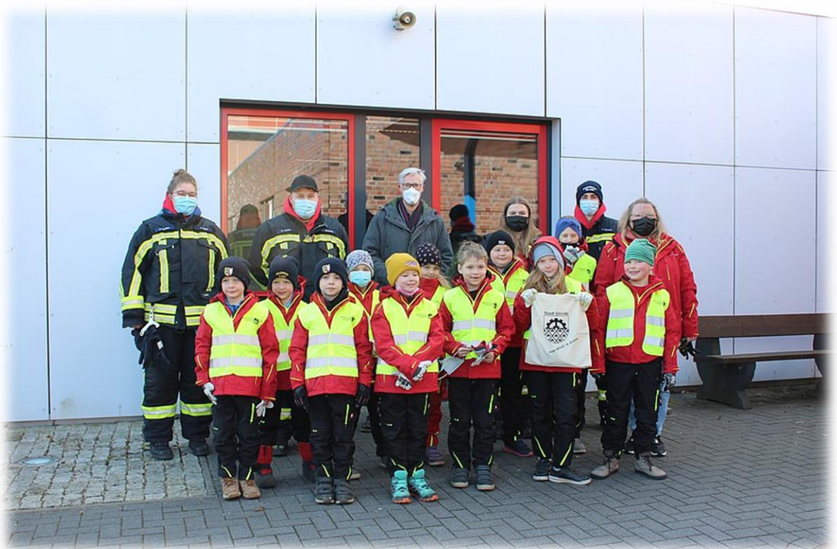
Bürgermeister Rainhard Zug unterstützte die Glinder Kinder-Feuerwehr beim Müllaufsammeln

Markt 26. 2. | 12. 3. | 2. 4. 2022 || GZ 23. 3. 2022