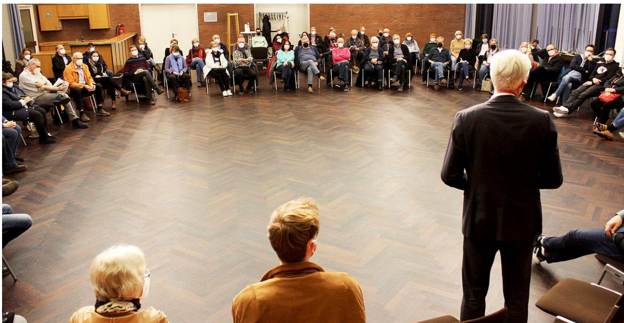
Erstes Vernetzungstreffen am 5. April

Markt 5. 3. | 12. 3. | 26. 3. | 2. 4. | 7. 5. 2022 || GZ 9. 3. | 30. 3. | 6. 4. | 13. 4. | 20. 4. | 27. 4. | 25. 5. 2022 | 4. 1. 2023