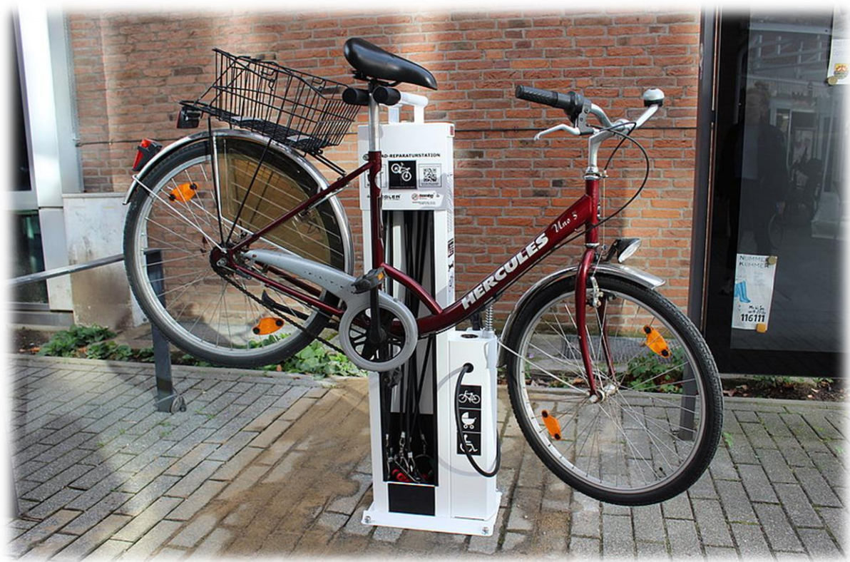
Die erste Fahrradservicestation der Stadt wurde Ende Oktober in Betrieb genommen

www.glinde.de 27. 10. 2022, Aufruf 12. 11. 2022 || GZ 2. 11. 2022