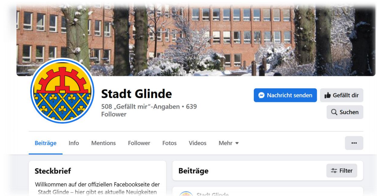
Der städtische Facebook-Kanal; Screenshot vom 30. 1. 2023

www.glinde.de 5. 1. 2022, Aufruf 15. 3. 2022 || Markt 29. 1. 2022