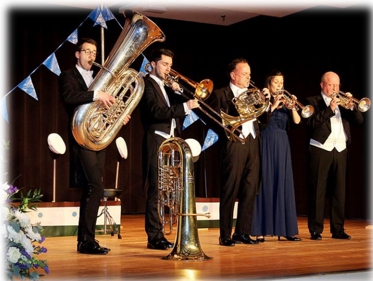
»Harmonic Brass« beim 5. Neujahrskonzert