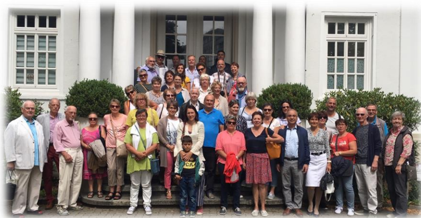
Ein großes Miteinander: die französische Delegation und ihre Gastgeber:innen.

BZR 26. 4. | 24. 7. | 30. 7. | 12. 8. 2019 || GZ 30. 7. | 13. 8. 2019