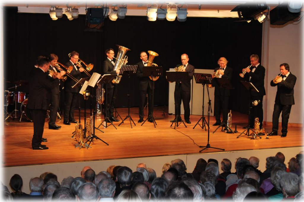
Anlässlich des Neujahrskonzertes gastierten die Echo-Klassik-Preisträger German Brass im Theater im Forum.