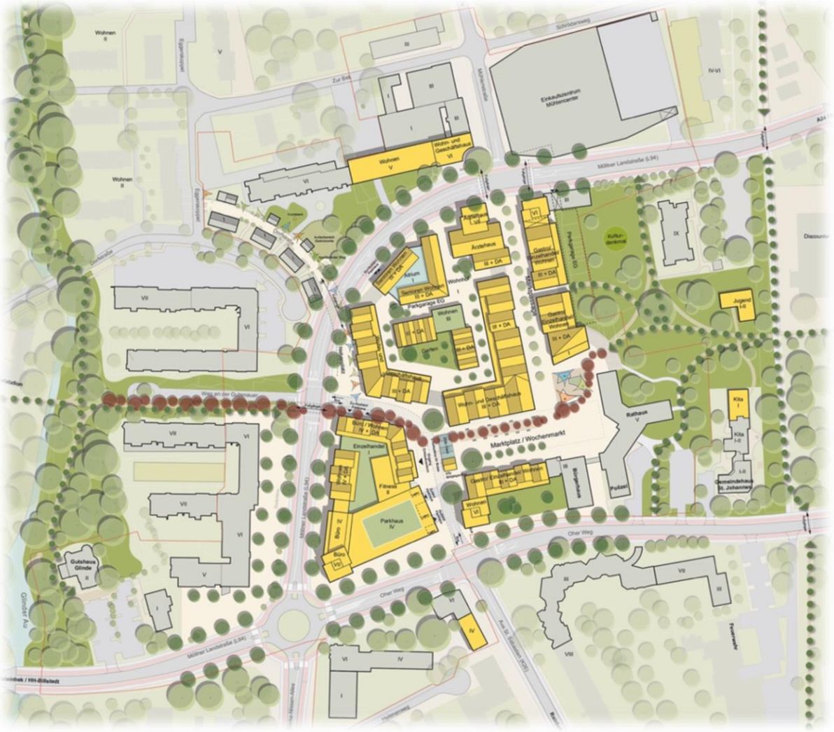
Rahmenplan Ortsmitte Glinde, Stand im Juni 2019.