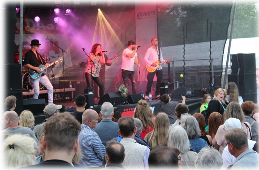
Bands wie Lazy Sunday begeisterten die Zuhörer:innen.