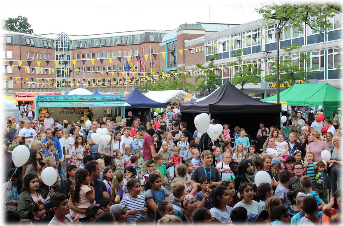
Die Verlosung der Laufkartenpreise auf der Bühne erregte große Aufmerksamkeit.