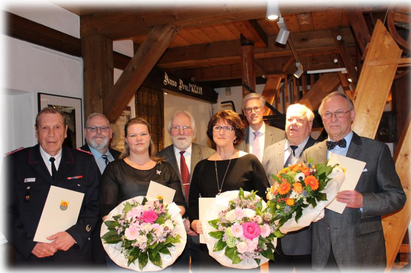
Beim 7. Ehrenamtstag wurden engagierte Glinder:innen wieder für ihren ehrenamtlichen Einsatz ausgezeichnet.

GZ 26. 2. | 2. 4. 2019 || BZR 21. 3. | 27. 3. 2019